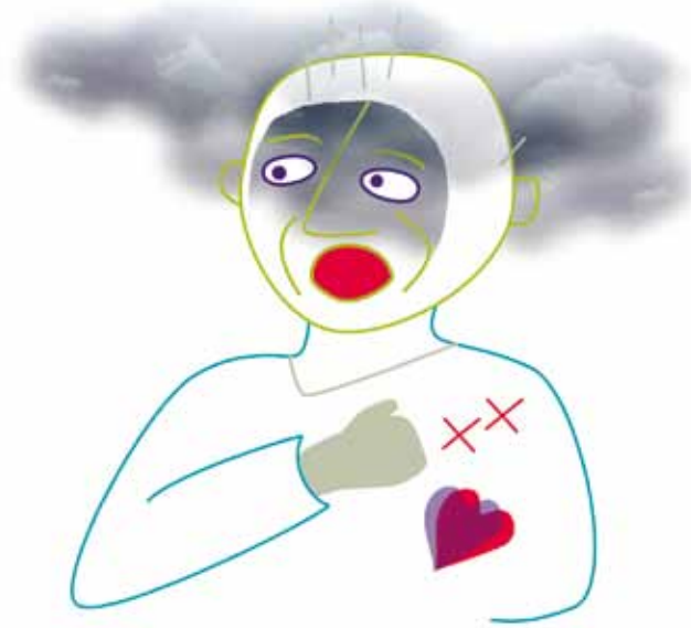
Een psychose is een angstige ervaring

Bij mensen met schizofrenie zijn afwijkingen in de hersenen gevonden. Ze hebben de ziekte al bij hun geboorte meegekregen. De ziekte wordt vaak pas later zichtbaar. Stress en belangrijke gebeurtenissen kunnen ervoor zorgen dat de ziekte zich ontwikkelt. Schizofrenie ontstaat dus niet door de opvoeding of door situaties in het gezin.