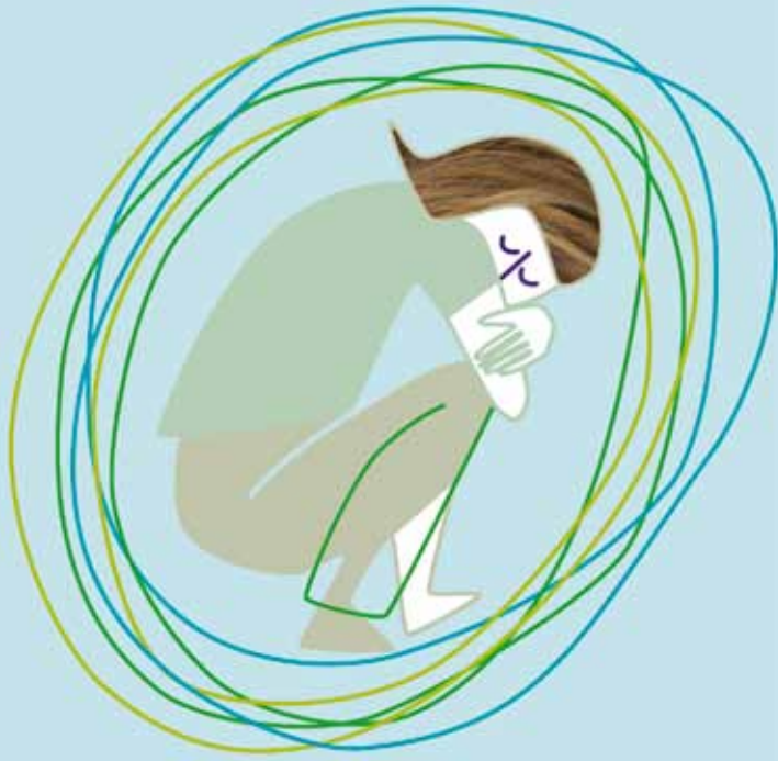
Alleen willen zijn

Een psychose kan ontstaan na een periode van stress of een moeilijke periode in iemands leven. Ook kan het een gevolg zijn van drugsgebruik of een depressie. Maar een psychose kan ook plotseling en zeer heftig opkomen.